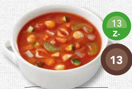
Minestrone soep vegetarisch