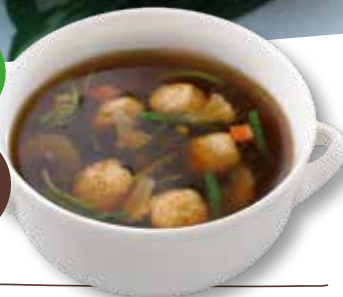
Groentesoep met balletjes