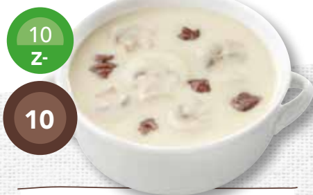
Champignonsoep met rundvlees