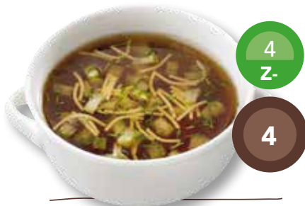
Venkelsoep met dille vegetarisch