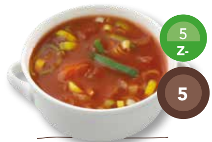
Tomatensoep met prei vegetarisch