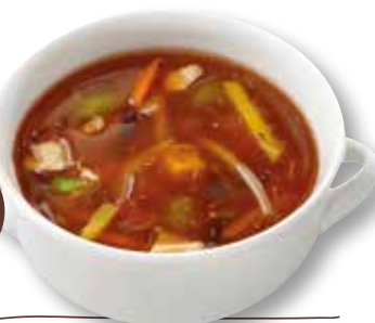
Tom ka kai