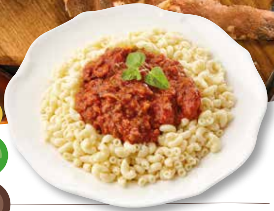
Pastaschotel van elleboogmacaroni, geruld gehakt, tomaat en Italiaanse kruiden