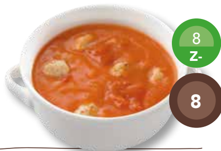
Tomatensoep met balletjes