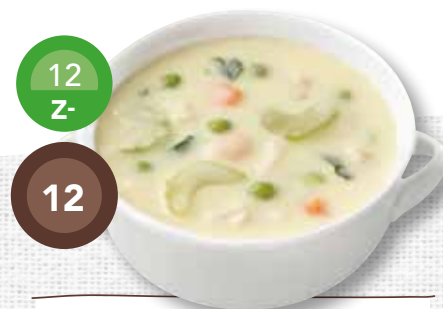
Koninginnesoep met kip