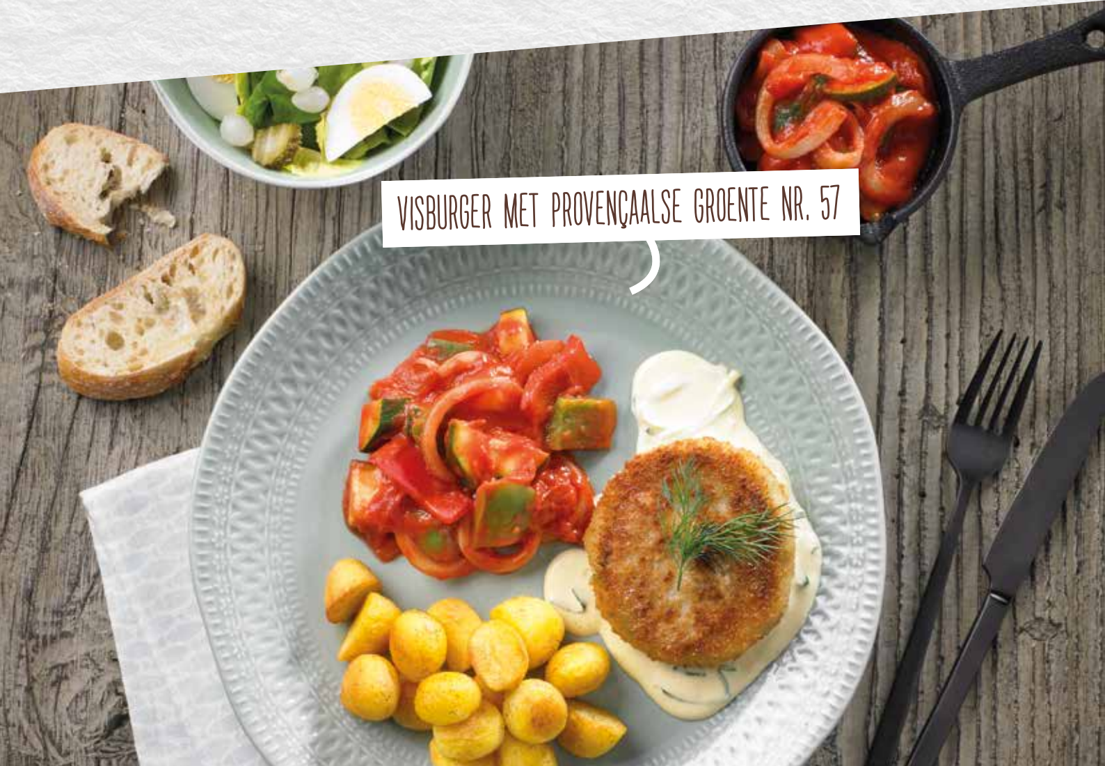
VISBURGER MET PROVENÇAALSE GROENTE NR. 57

Gestoofde kabeljauwfilet in een saus van rode pesto en tomaat met broccoli, bloemkool en wortel en gekookte aardappelen