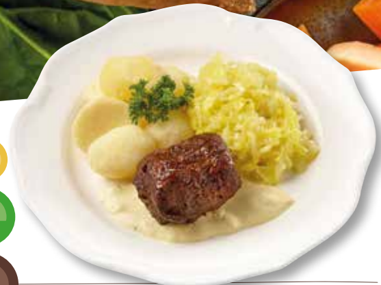
Gebraaden rundervink in een romige mosterdsaus met gesmoorde kruidige spitskool en gekookte aardappelen