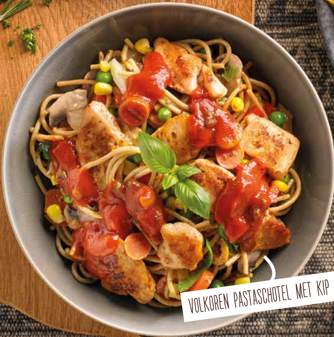
VOLKOREN PASTASCHOTEL MET KIP NR. 36