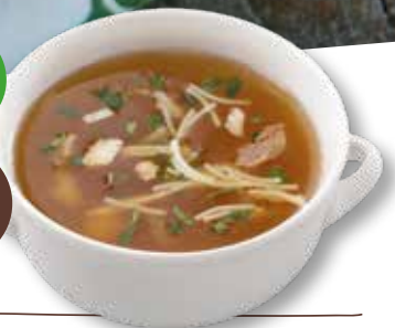
Kippensoep met vermicelli